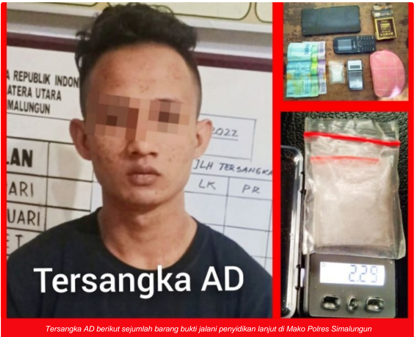
Tersangka AD berikut sejumlah barang bukti jalani penyidikan lanjut di Mako Polres Simalungun

SIMALUNGUN - Pemberantasan peredaran narkoba dan penindakan tegas terhadap pelakunya, merupakan prioritas utama dan juga wujud komitmen Satuan Narkoba Polres Simalungun.